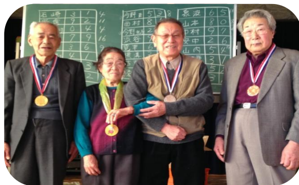
雄信内地区サロン入賞者のみなさん