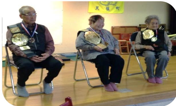
天塩地区サロン入賞者のみなさん